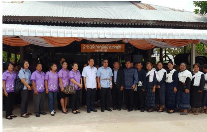
วิทยาลัย ผู้เฒ่าไทกะเลิง